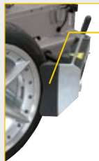
G800A11 Abdrücker Alufelgenschutz