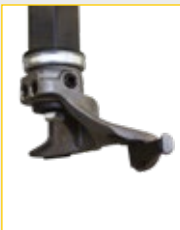
G800A132K (10 x kit) QUICK INSERT Satz Montagekopf- Alufelgenschutz