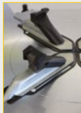
G800A131 (4 x kit) Klauenchutz