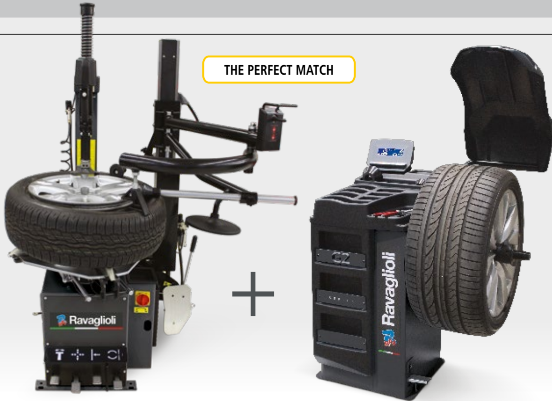
G5440V.22G + PLUS73