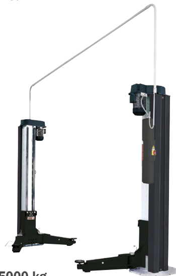
KPN250 BMW - 5000 kg 81 22 2 337 842 + 81 22 2 337 843

Kontakt: BMW AG Handelsausstattung, Bau- und Einrichtungsberatung 80788 München workshopequipment@bmwgroup.com