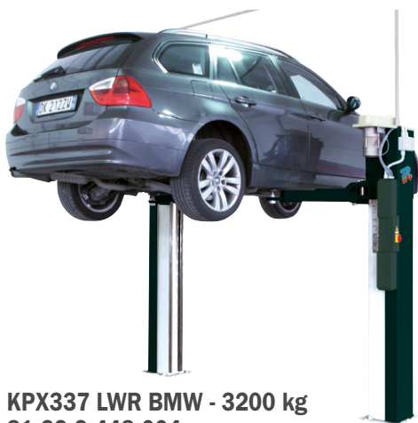
KPX337 LWR BMW - 3200 kg 81 22 2 448 004

Tubular structure made of 5 robot welded sections.